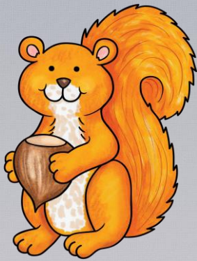
Abb.: © Kate Hadfield Designs | © tilde-edition.de