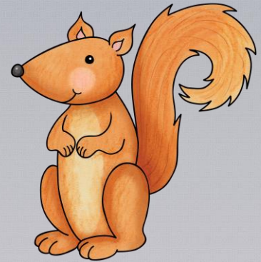
Abb.: © Kate Hadfield Designs | © tilde-edition.de

Das Eichhörnchen sammelt im Herbst Haselnüsse. Im Winter holt es sie aus dem Versteck.