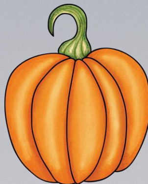
Abb.: © Kate Hadfield Designs | © tilde-edition.de