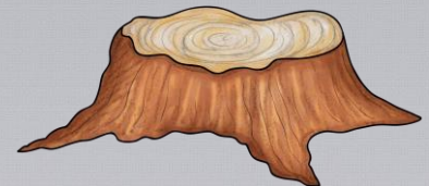
Abb.: © Kate Hadfield Designs | © tilde-edition.de

Kastanienblätter sind im Sommer grün. Im Herbst sind sie braun.