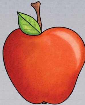
Abb.: © Kate Hadfield Designs | © tilde-edition.de